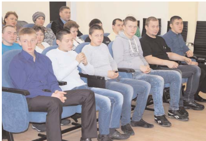
Призывники и их родители услышали ответы на волнующие их вопросы

Начальник отдела ВК отметил, что с января этого года граждане, не прошедшие военную службу по призыву, не смогут работать в государственных и муниципальных учреждениях. Он рассказал о процессе прибытия на сборный пункт и об отправке воен-