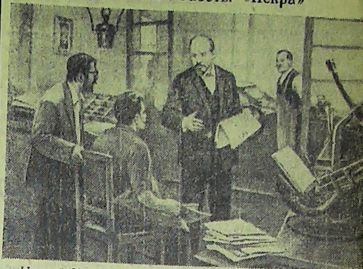
„Искра“ Картина художника Д. Иалбандяна.

22 декабря — 75 лет со дня выхода первого номера общерусской нелегальной марксистской газеты «Искра»