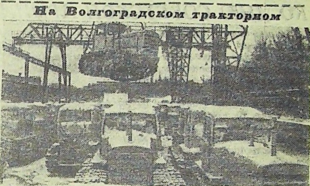
В семейство знаменитых пролетарских волежских богатырей ДТ-75 вошли болотоходные, крутосклонные, ДТ-75 С-скотские с мотором в 90 лошадиных сил. На снимке: отгрузка тракторов.