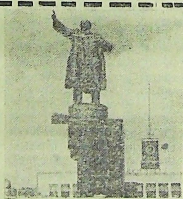
Памятник В. И. Ленину у Финляндского вокзала.