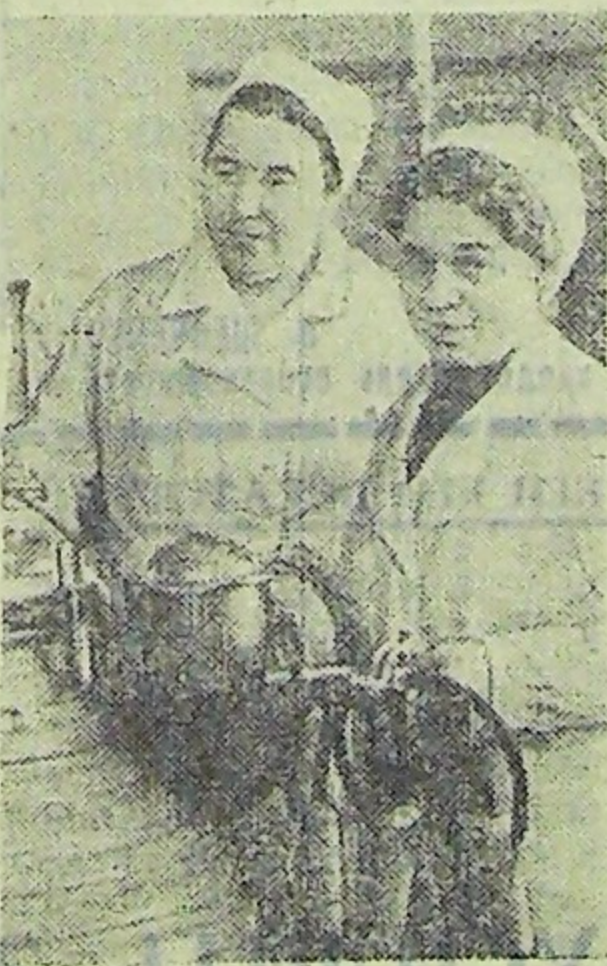
Животноводство — ведущая отрасль производства у тружен-

ников сел Нодмосковья. Сейчас в хозяйствах области определяются планы и обязательства пятого, завершающего года пятилетки.