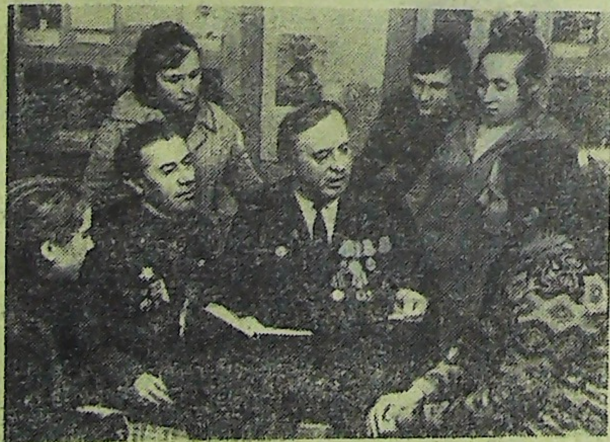
Украинская ССР. Партизанским краем называли в годы Великой Отечественной войны Холмский (ныне Корюковский) район на Черниговщине. В местных лесах развернул свою деятельность подпольный музей комсомольской славы.