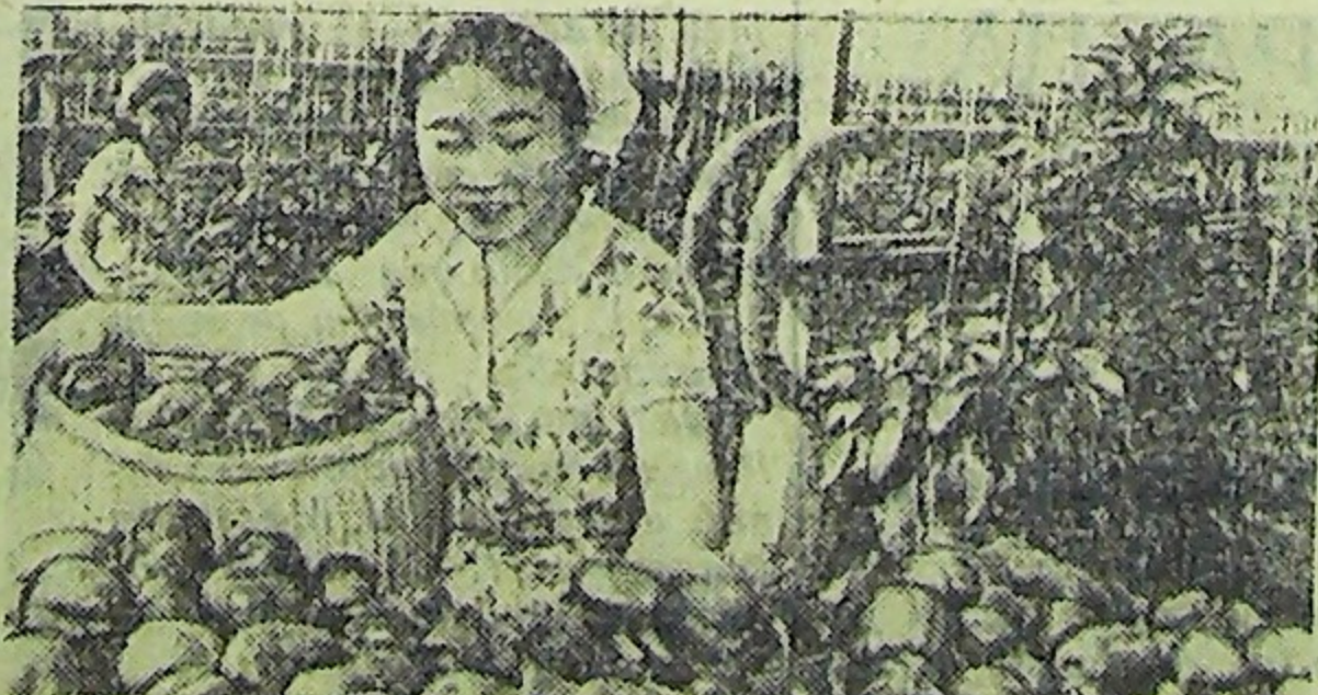
КНДР. В предместье Пехняна расположено большое тепличное хозяйство. Здесь выращивают помидоры, огурцы, салат, перец и даже арбузы. На снимке: тепличное хозяйство, сбор урожая.