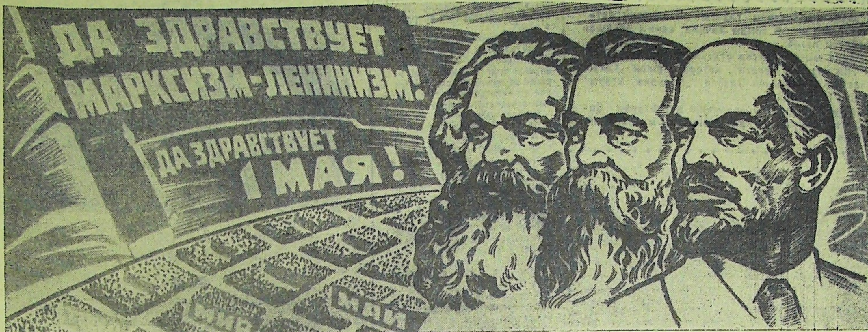
Плакат издательства "Московская правда".