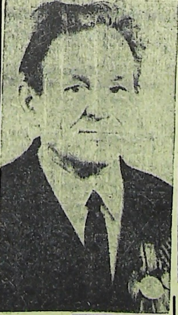
На снимке Клепиков И. М.

Помните, что только соблюдение инструкции по безопасному пользованию установками сжиженного газа поможет избежать несчастных случаев. А. АНУФРИЕВ.