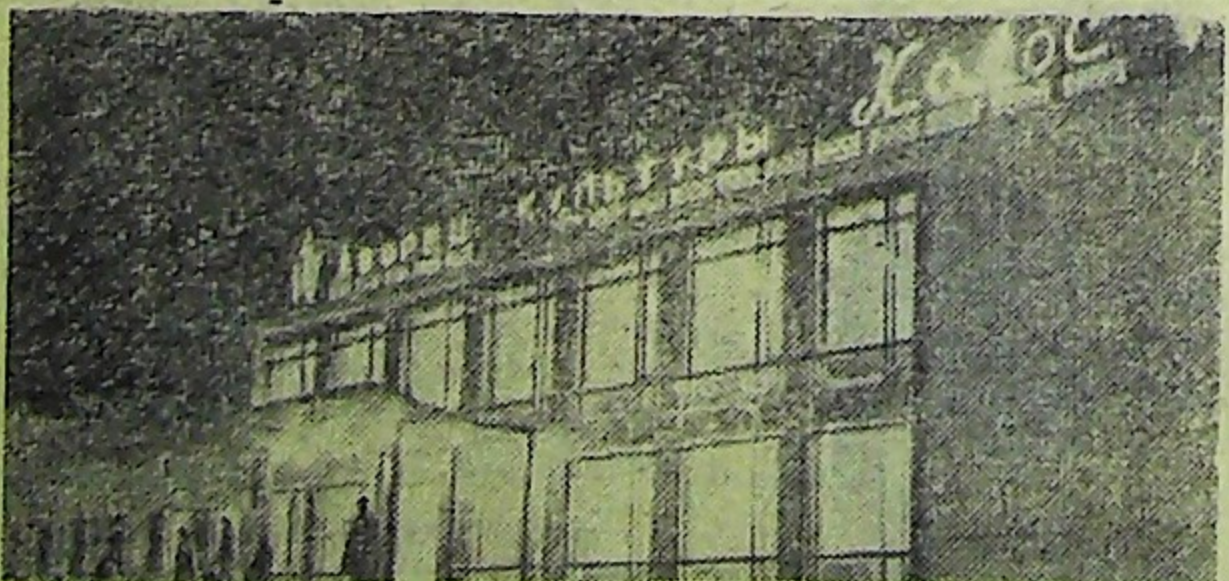
Дворец культуры «Колос» построен в селе Ульском — центре степного сельскохозяйственного района Челябинской области.