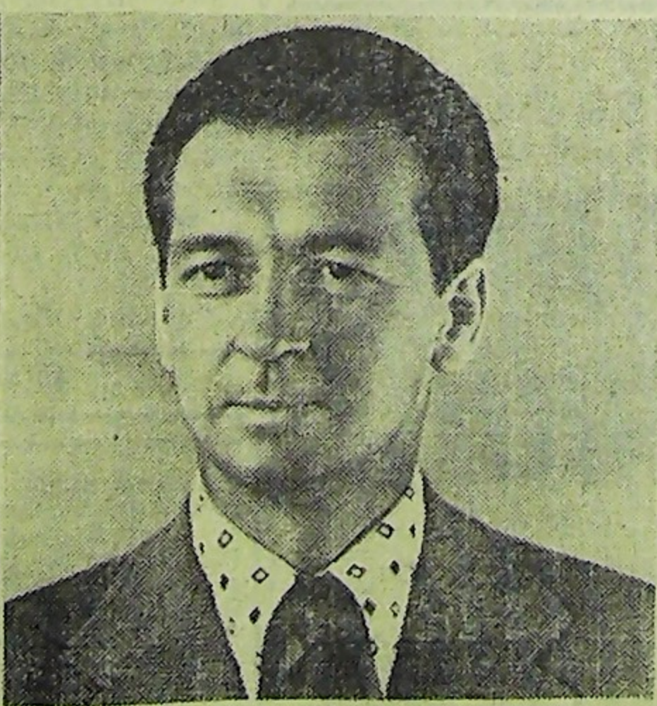
Командир космического корабля «Союз-18» летчик-космонавт СССР Герой Советского Союза Петр Ильич Климук и бортиженер летчик-космонавт СССР Герой Советского Союза Виталий Иванович Севаст'янов.