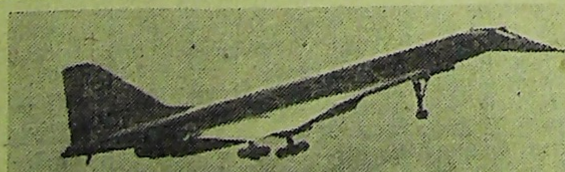
МОСКВА. Сверхзвуковой пассажирский самолет ТУ-144 — один из экспонатов советского раздела Международно-

На снимке: самолет ТУ-144 заходит на посадку.