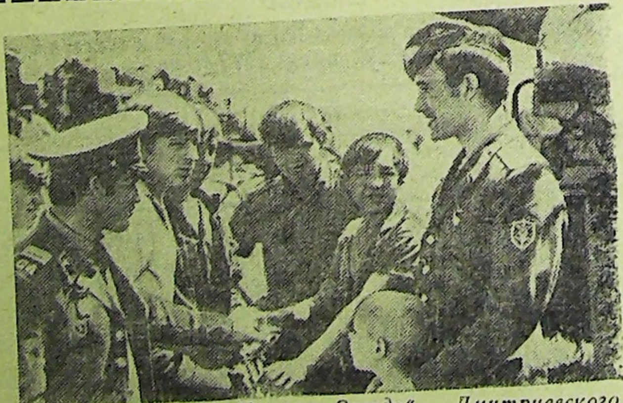
Курская область. Колхоз „Звезда“ Дмитриевского района — экономически развитое многоотраслевое хо-

с. Мужа, типография управления издательства, полиграфии и книжной торговли Тюм. обл. сов. эком.