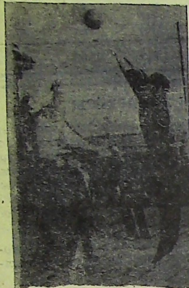
Молодежь с Мужей любит играть в волейбол.

Эти слова принадлежат Генеральному секретарю ЦК КПСС тов. Л. И. Брежневу.