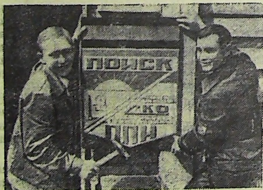
Пермская область. У пяти тысяч

студентов Прикамья — трудовой семестр. Строительно-конструкторский отряд «Поиск» Пермского политехнического института строит комплекс на 3 тысячи голов крупного рогатого скота в колхозе «Юговский» Кунгурского района. Его проект разработан студентами строительного факультета и предусматривает максимальное использование местных строительных материалов. Это удешевит строительство и сократит сроки ввода комплекса в эксплуатацию.