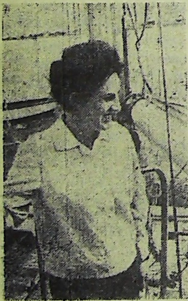
Польские женщины занимают достойное место во всех областях экономи-

ки и культуры страны. Более двух пятых общего числа труженников народного хозяйства ПНР—женщины. В легкой, химической, пищевой промышленности—их большинство. А из каждых десяти медицинских работников, из каждых десяти учителей—восемь женщины. С каждым годом все большее их число овладевает новыми профессиями и сейчас занимает немало таких должностей, которые раньше считались чисто мужскими.