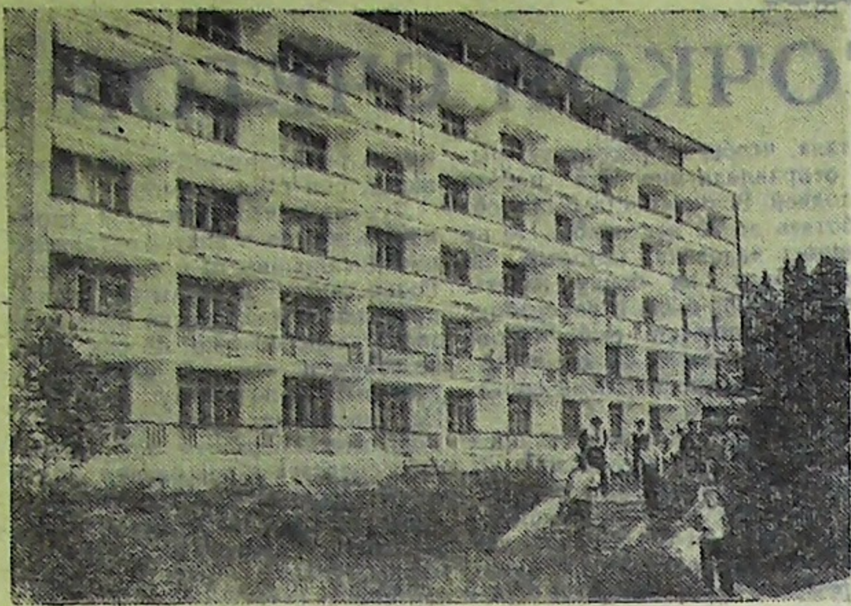
Пермская область. Гостеприимно распахнула двери первая на Урале колхозная здравница «Прикамские нивы». Она расположена на территории известного в стране своими целебными водами курорта «Усть-Качка». Уральская Магеста почти универсальна. Здесь лечат болезни сердца, гипертонию, различные невроты. В течение года в санатории сможет отдохнуть 3,5 тысячи сельских тружеников. Новый санаторный комплекс построен на средства колхозов области. На снимке: новый санаторий «Прикамские нивы».