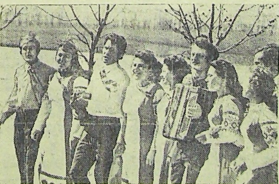
Донецкая область. Заслуженным успехом пользуется самодеятельный вокально-инструментальный ансамбль «Чаревница» Дома культуры села Казачье Новоазовского района. Все участники ансамбля работают в колхозе «Победа», а свободное время отдают художественной самодеятельности.