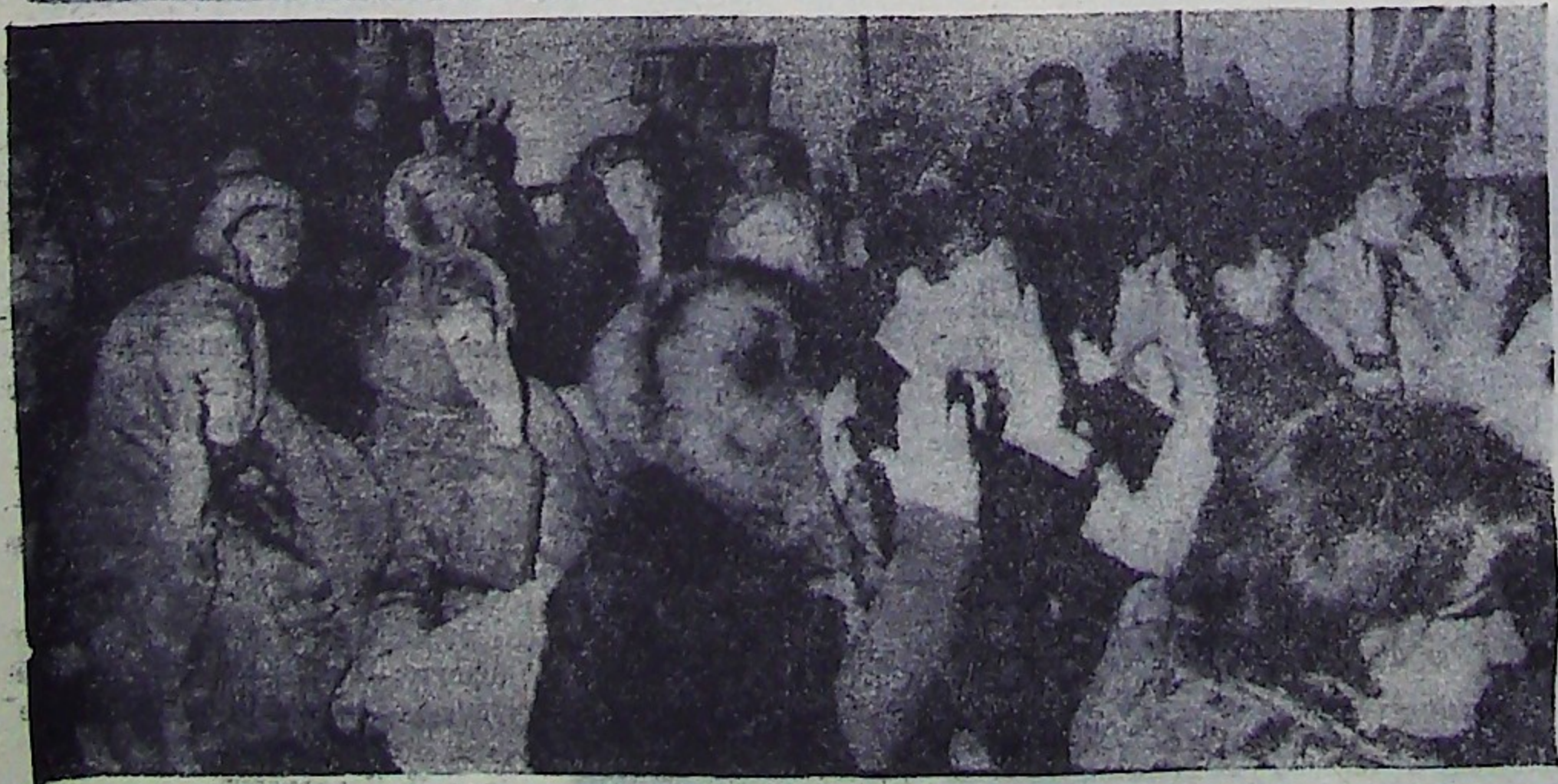
Горячую поддержку и одобрение встретило в районе Письмо ЦК КПСС, Совета Министров СССР, ВЦСПС и ЦК ВЛКСМ „О развертывании социалистического соревнования за выполнение и перевыполнение плана 1978 года и усиление борьбы за повышение эффективности и качества работы“.