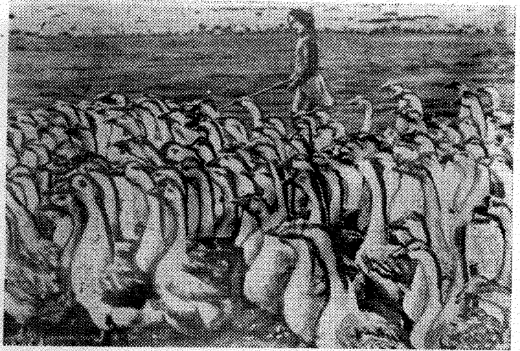
„Королева гусиного царства“