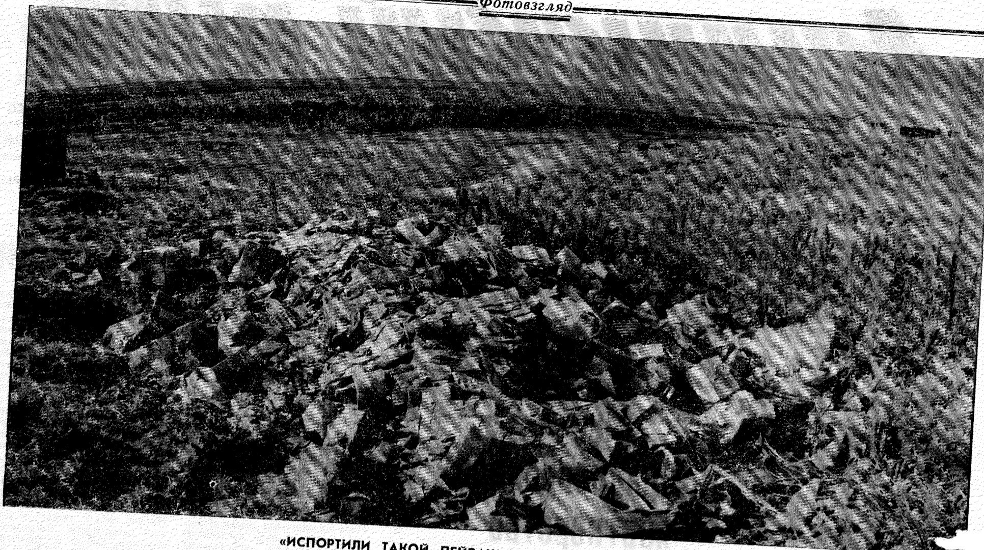
«ИСПОРТИЛИ ТАКОЙ ПЕЙЗАЖ...»