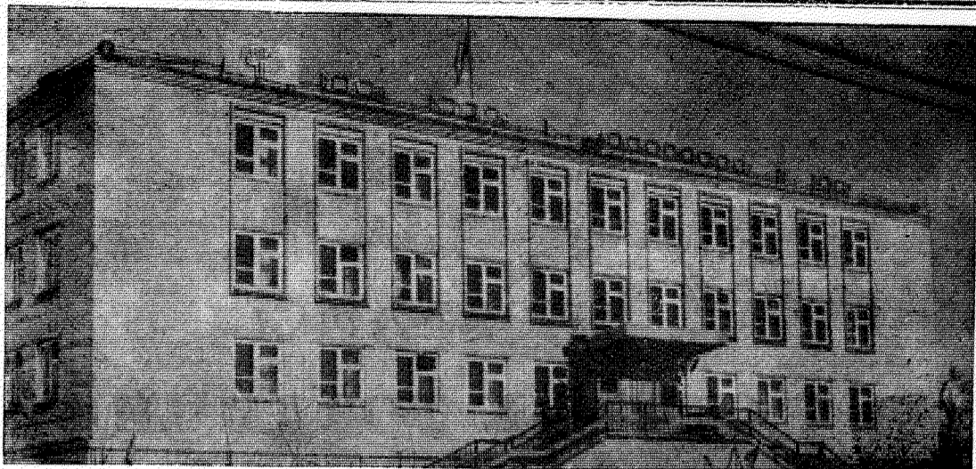
Это обсуждается на сессии

ИЗДАЕТСЯ С 14. 10. 1944 ГОДА. № 135 (5286) ЧЕТВЕРГ, 15 НОЯБРЯ 1990 ГОДА ♦ ВЫХОДИТ ТРИ РАЗА В НЕДЕЛЮ ♦ ЦЕНА 3 КОП.