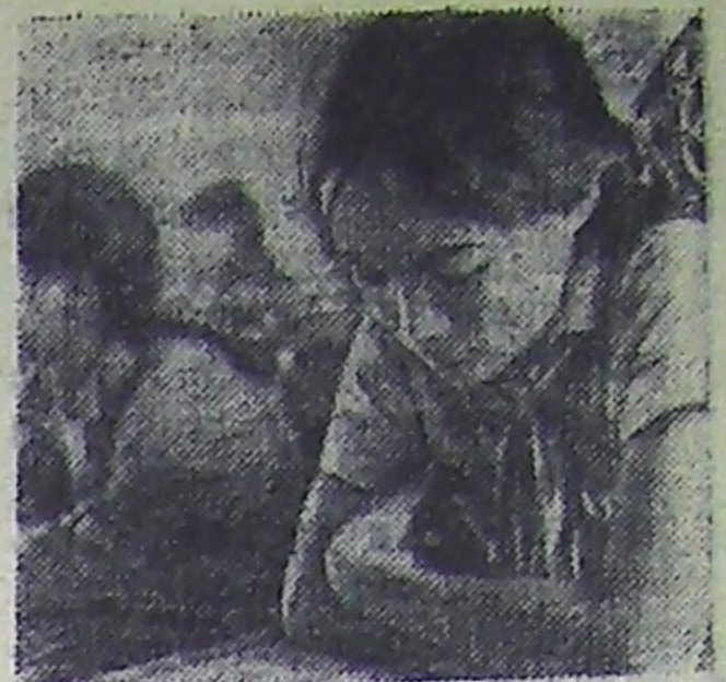
Демократическая Республика Вьетнам На уроке в школе в деревне Дий Ким.