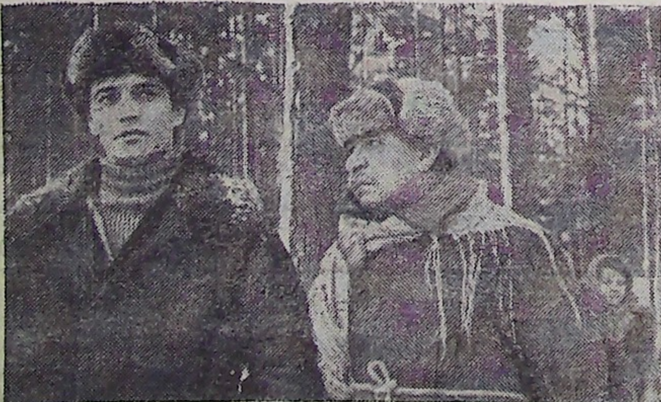
МИНСК. «Время выбрало нас» — так называется новый пятисерийный цветной художественный фильм, съемки которого идут на киностудии «Белорусьфильм». Он рассказывает о том, как действовало комсомольское подполье Белоруссии в годы Великой Отечественной войны.

Е. МАТВИЕНКО, секретарь комиссии по делам несовершеннолетних