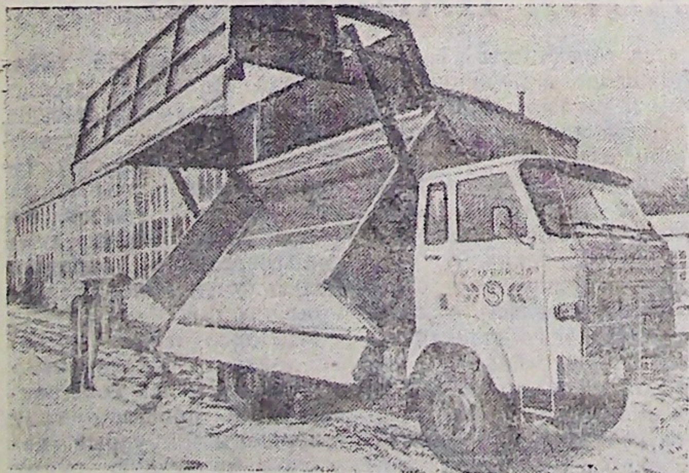
Польша. Страховицкий автозавод—большое современное объединение, выпускающее различные модификации. Это и вседорож „Стар-660“, малотонажные грузовики „Стар-28“ и „Стар-29“, и автоцистерна для загрузки самолетов сельскохозяйственной авиации химическими препаратами.

Б. КОЗАЧЕНКО, главный санитарный врач района.