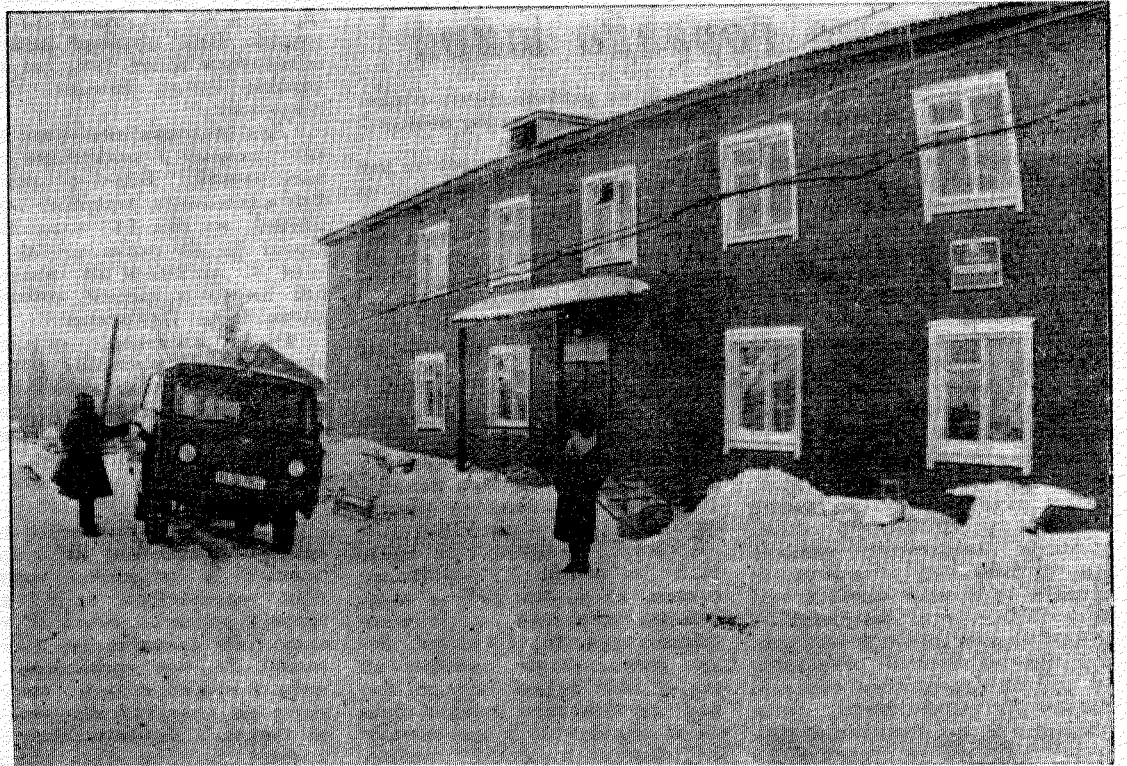
Не так давно в районном центре открылась новая поликлиника. На третьей странице сегодняшнего номера—репортаж наших корреспондентов из нового дома для медицины.

Также прошли выдвижения кандидатов в депутаты сельских Советов, где не полностью сформирован депутатский корпус. А. КОНЕВ.