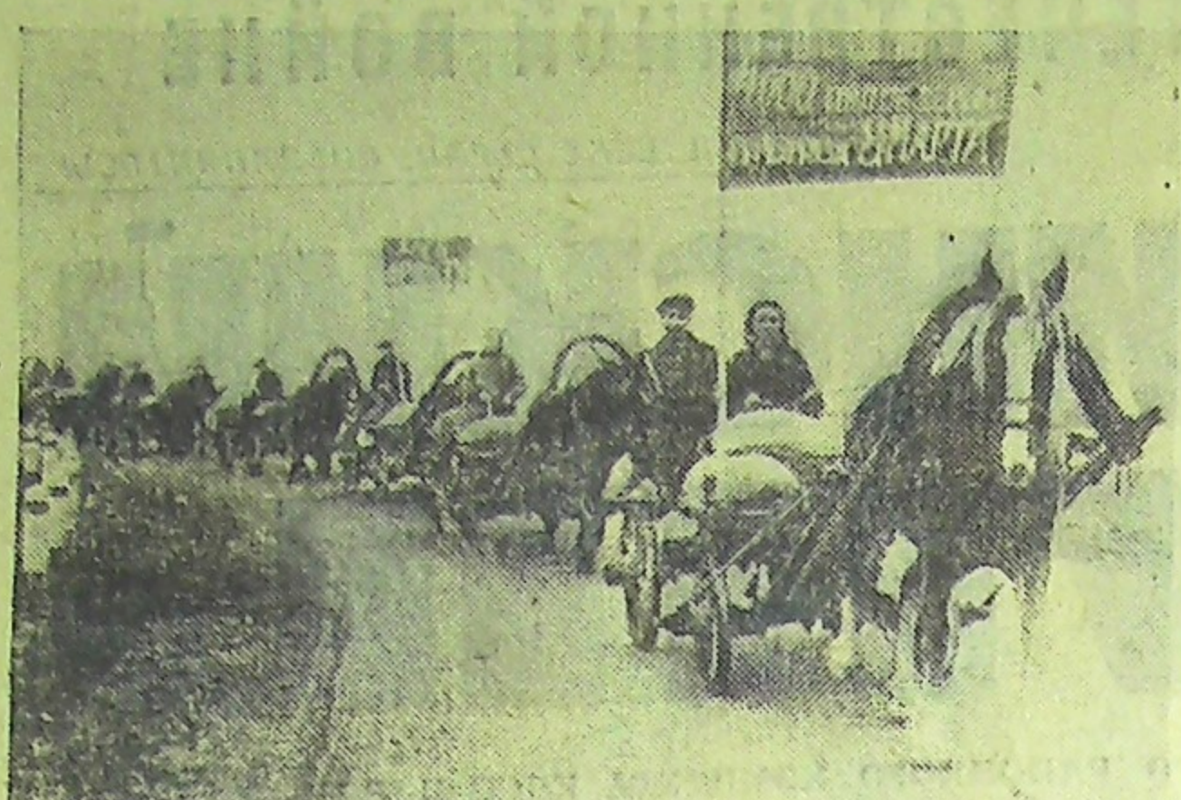
1944 год, Ярославская область. Хлеб—фронту.