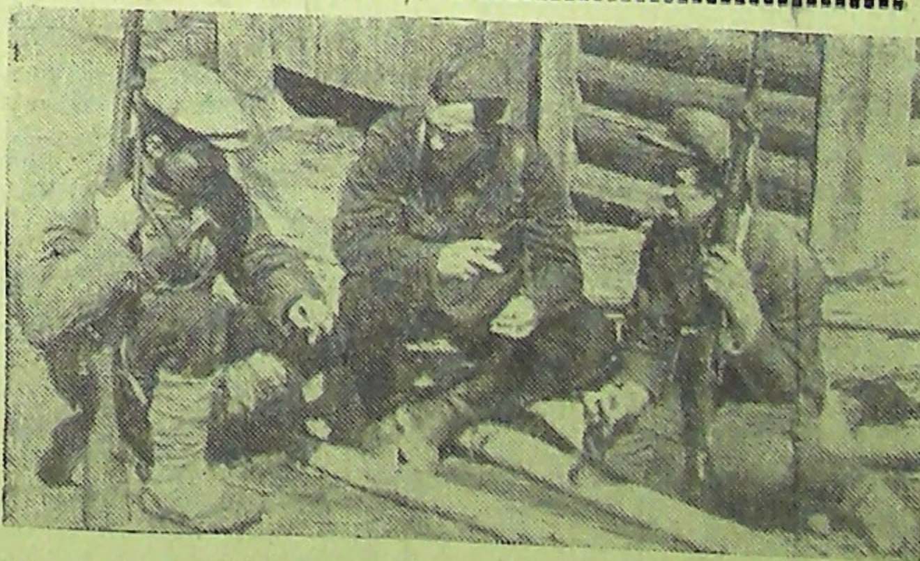
С самого начала войны на советской земле широко развернулось партизанское движение. На снимке: командир партизанского отряда беседует с крестьянами—членами группы самозащиты.