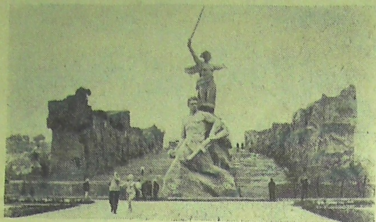
Волгоград. Памятник-монумент героям Сталинградской битвы на Мамаевом кургане. Авторы ансамбля—народный художник СССР Е. Вучетич и архитектор Я. Белопольский.