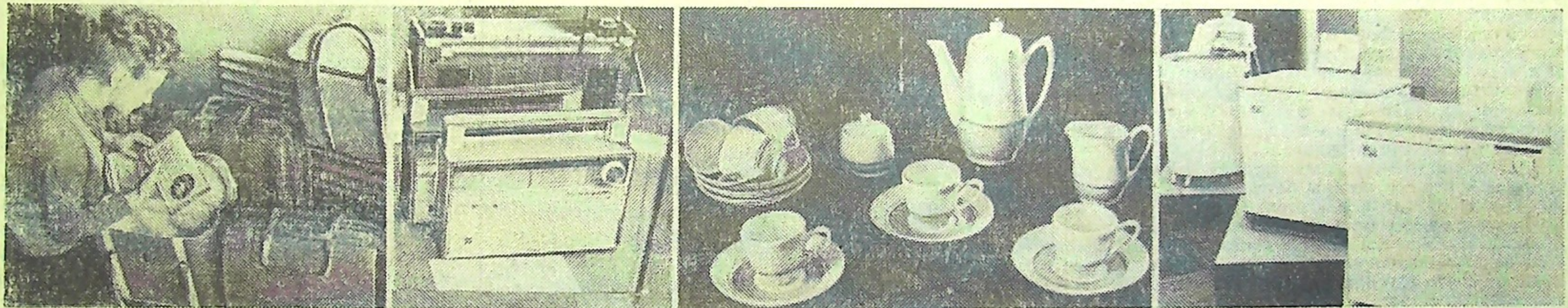
Почти 6 тысяч образцов новых товаров народного потребления внедряются в производство в юбилейном, 1967 году. На снимках (слева направо): сумки-холодильники (выпускаются в Горьковской области), переносной радиоприемник «Меридиан» (Киев), чайный сервиз (Ереван), стиральные машины (Кшишев, Москва).