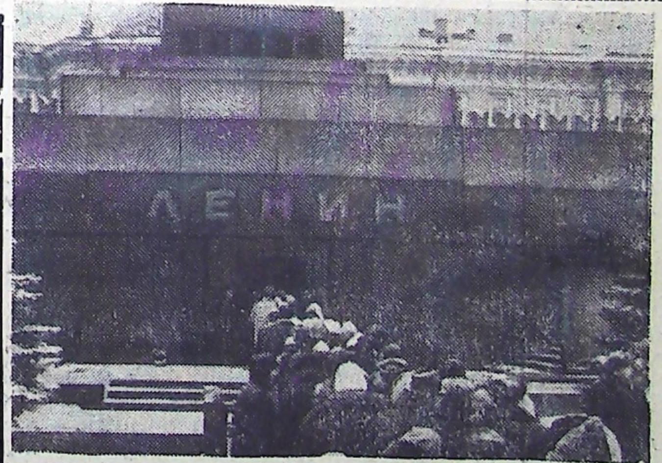
Москва. Красная площадь. У Мавзолея В. И. Ленина.

Постановление районного исполнительного комитета направлено в окрисполком для утверждения.