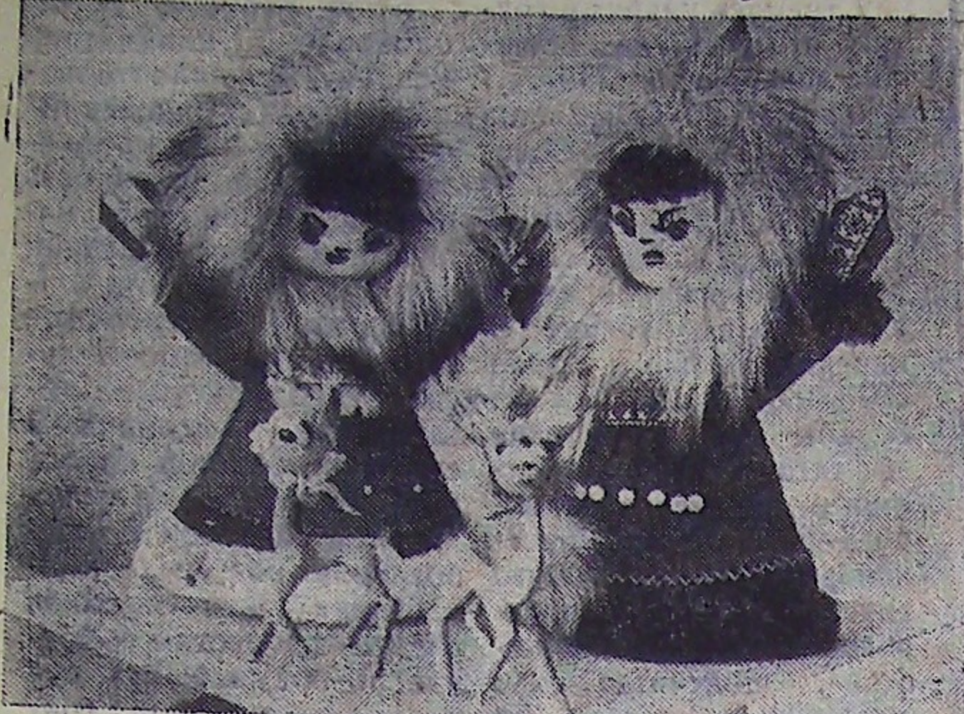
Таким маршрутом скоро отправятся на XI Всемирный фестиваль молодежи и студентов сувениры, сделанные учениками хабаровской школы №6.

Работы юных художников постоянно экспонируются на всесоюзных и краевых выставках школьного творчества. А на X Всемирном фестивале, проходившем в 1973 году в Берлине, сувениры хабаровских школьников удостоены грамот и дипломов.