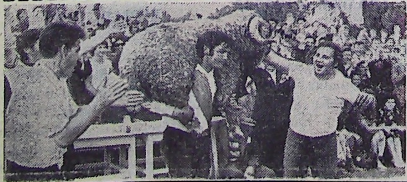
Ежегодно в башкирских деревнях отмечают традиционный национальный праздник «сабантуй». С утра на обширную поляну—майdan на лошадях, автомобилях и просто пешком стекаются празднично одетые люди из окрестных сел. Начинается праздник подведением итогов весенних полевых работ. Лучшим чабанам, трактористам, полеводам вручают ценные подарки. А затем на празднике проходят спортивные состязания наездников и борцов, участников национальных спортивных игр. Каждый может испытать свою силу ловкость, удаль. На снимке: празднование «сабантуй» в деревне Арасланова Мелеузовского района Башкирской АССР. На снимке: приз самому сильному.