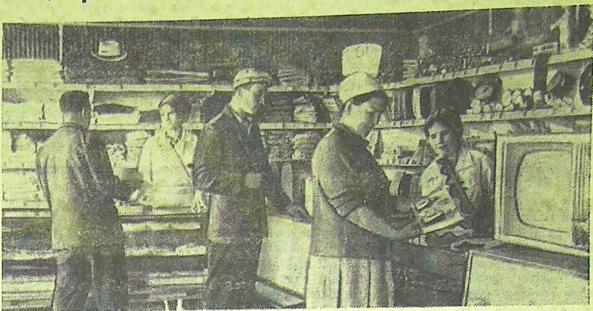
В магазине деревни Карамышево (Тульская область) можно приобрести все необходимое.

Торговое обслуживание населения—государственной важности дело, и оно требует от работников прилавка высокой культуры, организованности и ответственности перед населением.