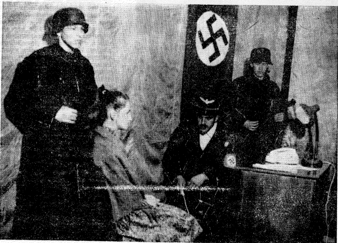
На снимке: сцена из спектакля «Пока бьется сердце».