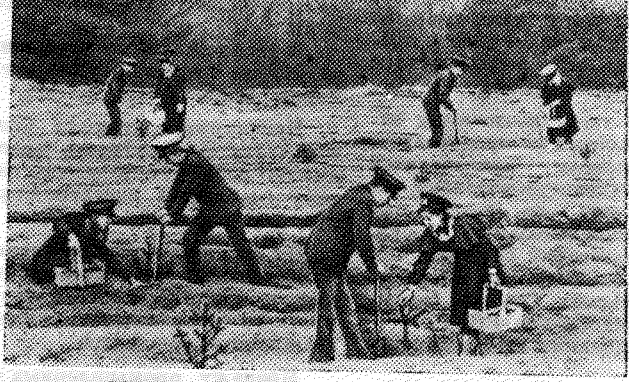
Литовская ССР. В настоящее время в Литве насчитывается 240 школьных лесничеств, которые объединяют 10 тысяч учащихся. За сезон республиканский отряд высаживает молодые деревца на 800 гектарах. Нынешней весной, когда желанная

гостя пришла чуть ли не на месяц раньше обычного, приступили к весенним работам укмергских юные лесничие.