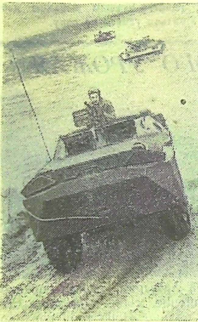
Идут тактические учения. Преодолевается водный рубеж.