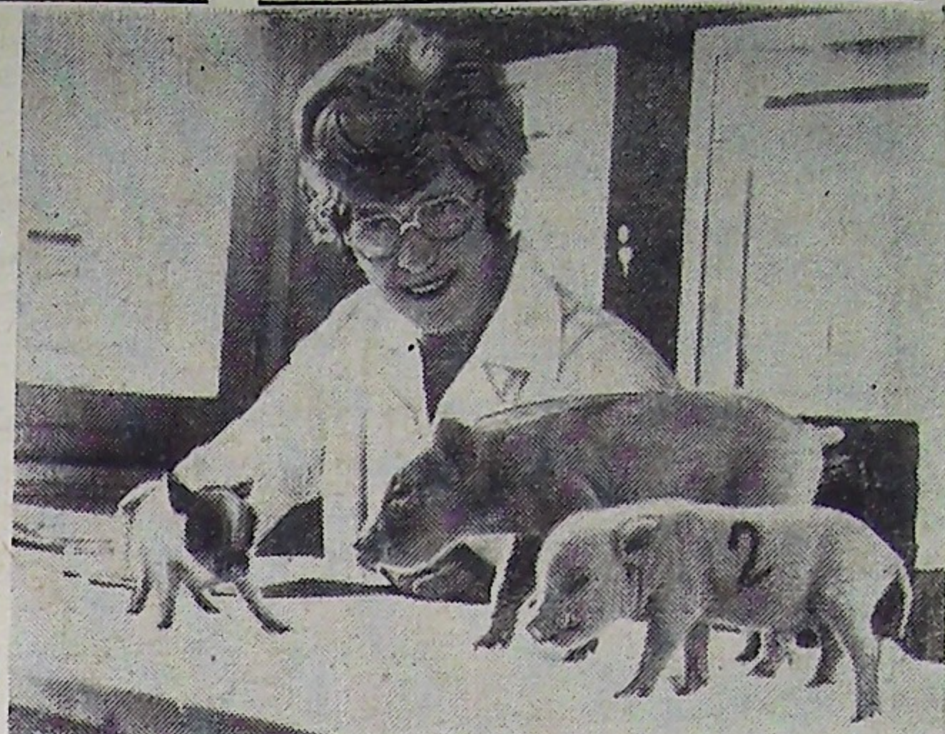
ГДР. В целях проведения научных медико-биологических исследований учеными Берлинского университета имени Гумбольдта выведена порода вот таких миниатюрных животных.

Находишь объяснение: работа, приносящая удовлетворение, не бывает тяжелой. В. ТИТОВ.