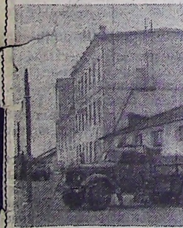
Стремительными темпами развивается промышленность Монгольской Народной Республики. На базе успешно развивающегося зернового хозяйства в стране построены высокопроизводительные комбинаты по переработке зерна.