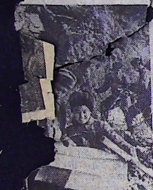
Корейская Народно-Демократическая Республика.