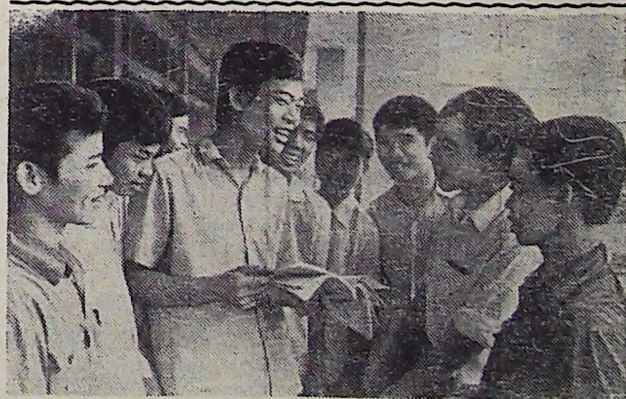
СФВ. Вопреки измышлениям пекинской пропаганды о том, что проживающие во Вьетнаме китайцы подвергаются преследованиям, гонениям и насильственной высылке из страны, все лица китайской национальности пользуются теми же правами, что и представители других национальностей, проживающих в стране. Они являются полноправными членами многонациональной семьи социалистического Вьетнама.

После летнего перерыва артисты приступили к репетициям.