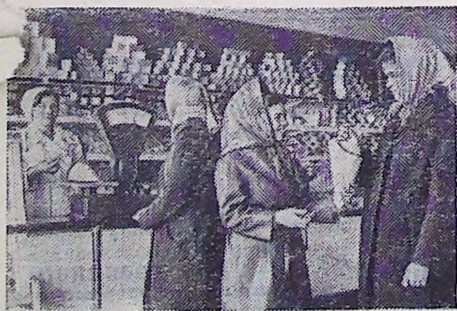
Расширяется сеть магазинов в селах. Построен новый магазин и в деревне Пушкири Ефремовского района Тульской области. На снимке: в новом магазине.