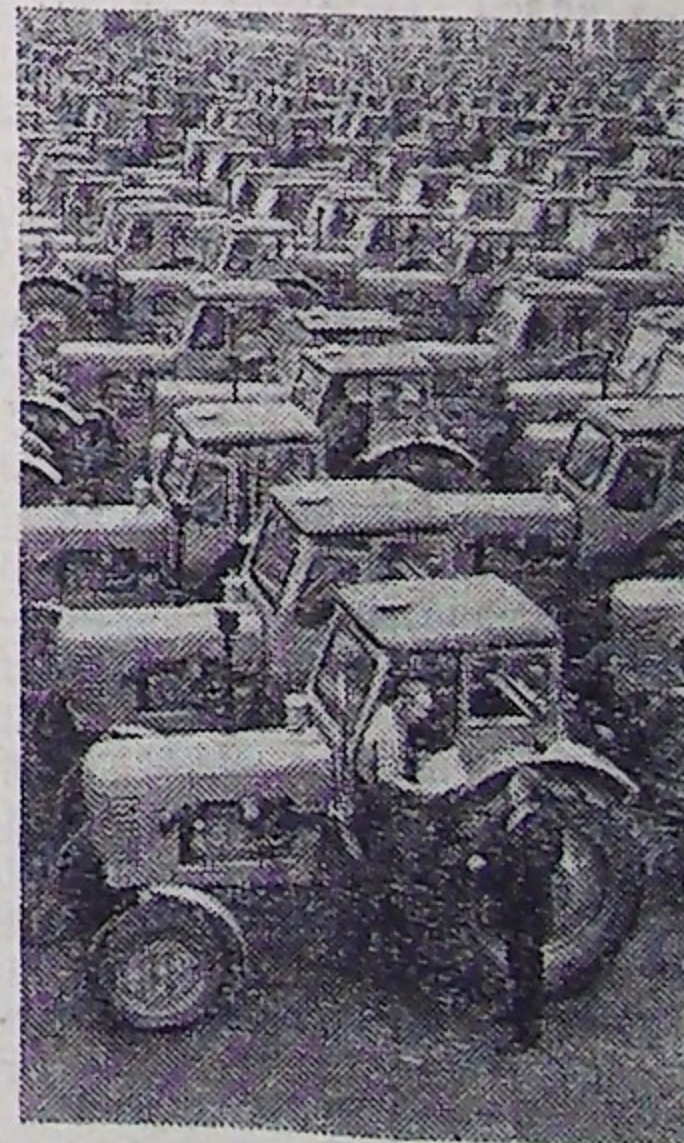
С каждым днем увеличиваются поставки машин сельскому хозяйству. Соревнуясь за достойную встречу 50-летия Советской власти, рабочие и специалисты Минского тракторного завода ежемесячно выпускают сверхплановые тракторы. Машины с маркой «Беларусь» завоевали большую популярность.