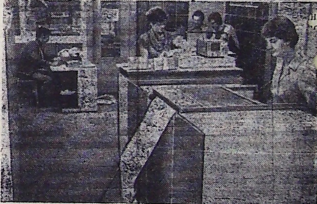
Подготовка к Всесоюзной переписи населения

Всесоюзная перепись населения, которая будет проведена с 17 по 24 января 1979 года, является одной из наиболее крупных и сложных статистических работ. Перепись имеет огромное значение для политической, экономической и культурной жизни страны. Ее результаты будут использованы для текущего и перспективного планирования народного хозяйства, для социологических исследований и научных прогнозов предстоящих перемен.