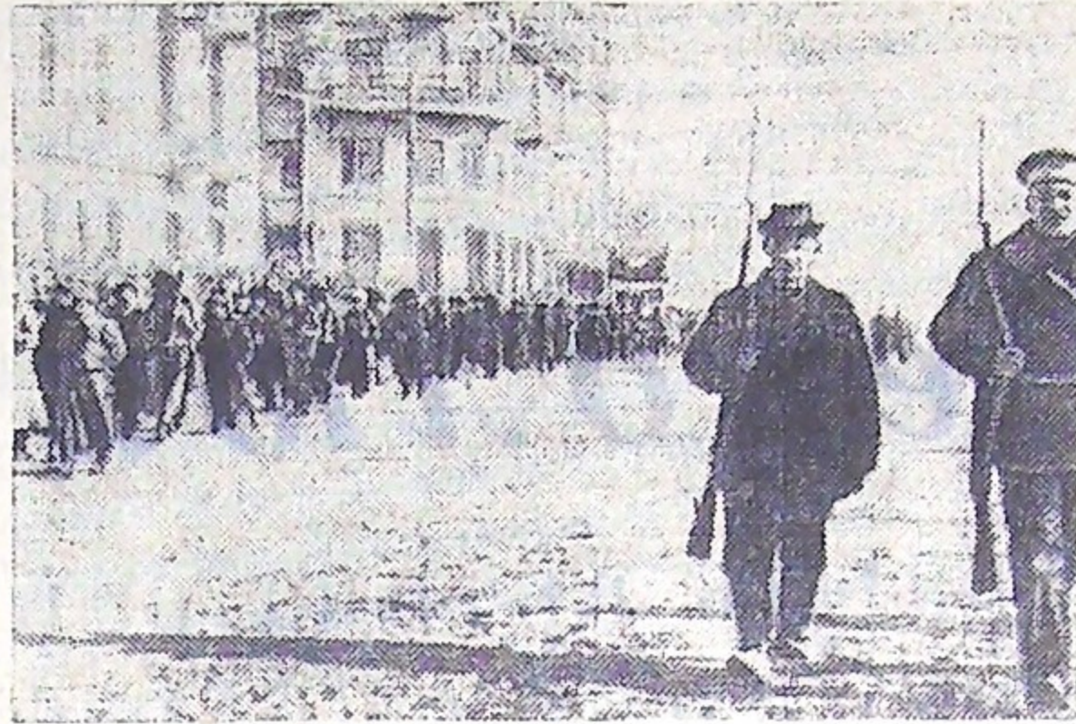
Чита 1917 год. Красная гвардия.