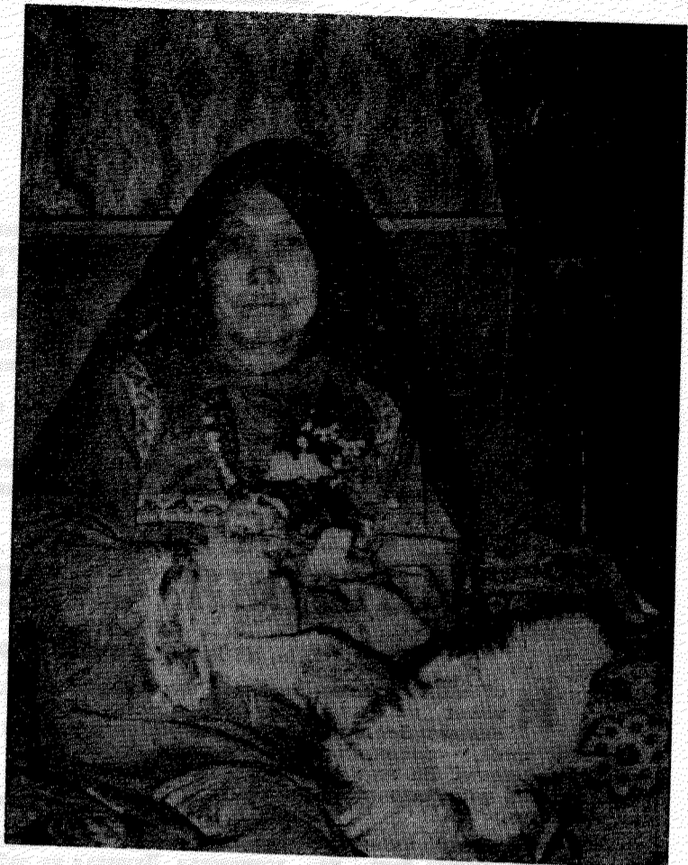
(с. Шурышкары)