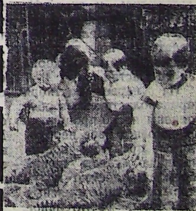
В будапештском зоопарке. Эти смиренные полосатые котята, которых пока еще безбоязненно может погладить ребенок, скоро превратятся в могучих красавцев-тигров.