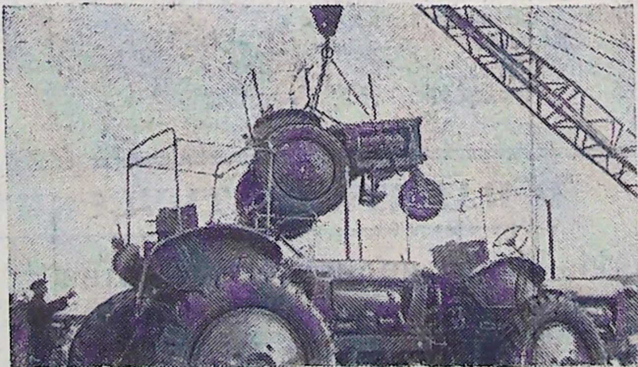
Ташкент. Тракторосборочный завод выпустил уже более 100 тысяч тракторов. Эту машину можно встретить не только на полях всех хлопкосеющих республик Советского Союза, но и в 25 странах Азии, Африки, Латинской Америки и Европы.

На снимке внизу: на площадке готовой продукции.