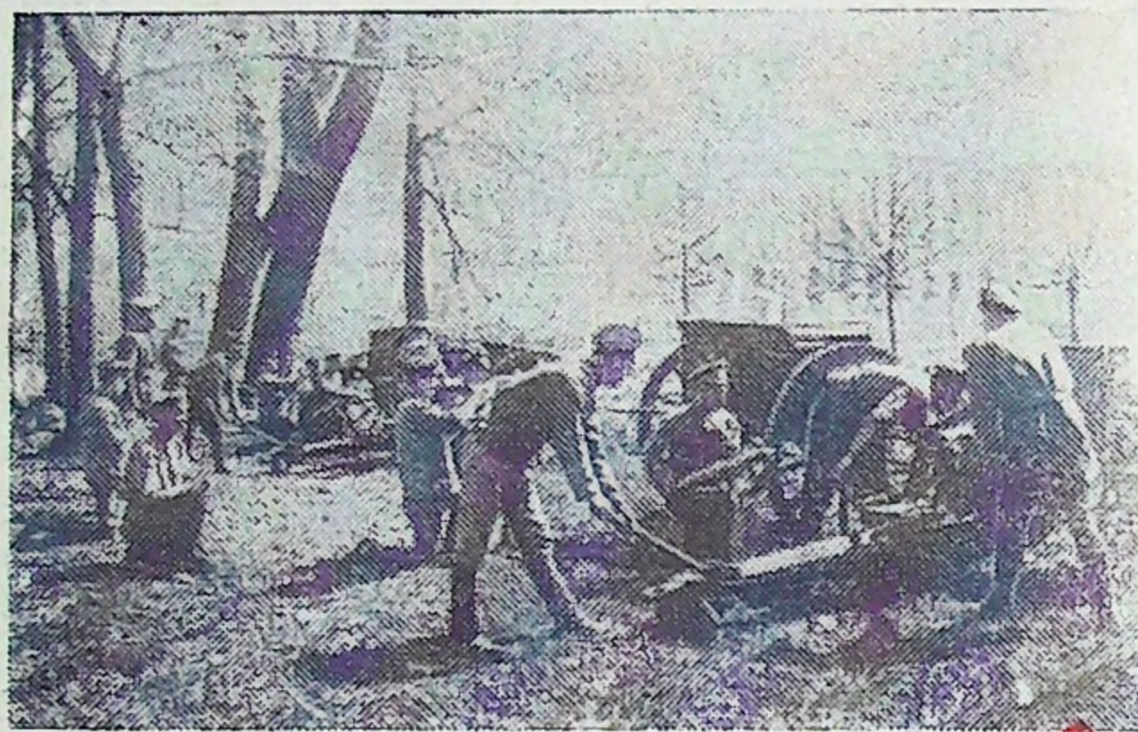
Артиллеристы—участники вооруженного восстания у Смольного Петрограда, 24-25 октября 1917 г.