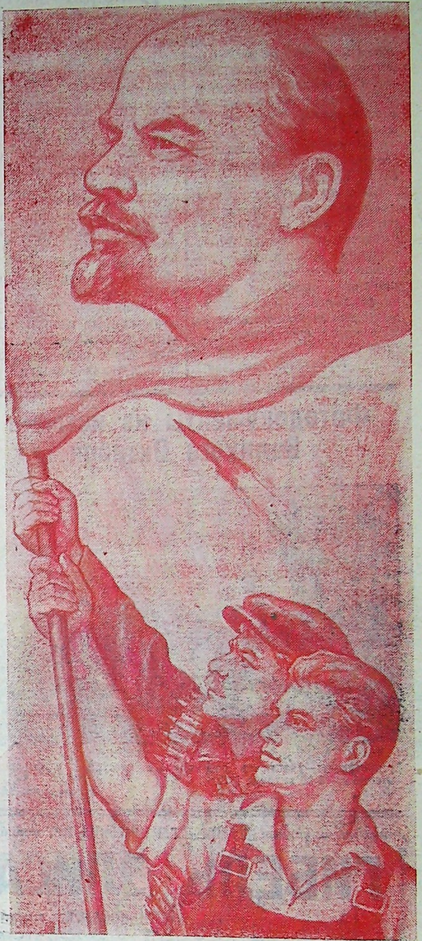
Рисунок художника А. Кручины.

Отмечая 50-летие Советской власти, скромные успехи, которыми встретили труженики района юбилей, мы понимаем, что это есть результат партийного руководства хозяйственным и культурным строительством. Первичные партийные, районная партийная организация обеспечивают авангардную роль во всех звеньях жизни района. Отмечая 50-летие, мы в то же время должны видеть, что перед нами стоят еще более сложные и ответственные задачи. Долг трудящихся, долг партийной организации района—нести еще выше знамя Великой Октябрьской социалистической революции, усиливать трудовое напряжение, приумножать материальные и духовные богатства нашей Родины!