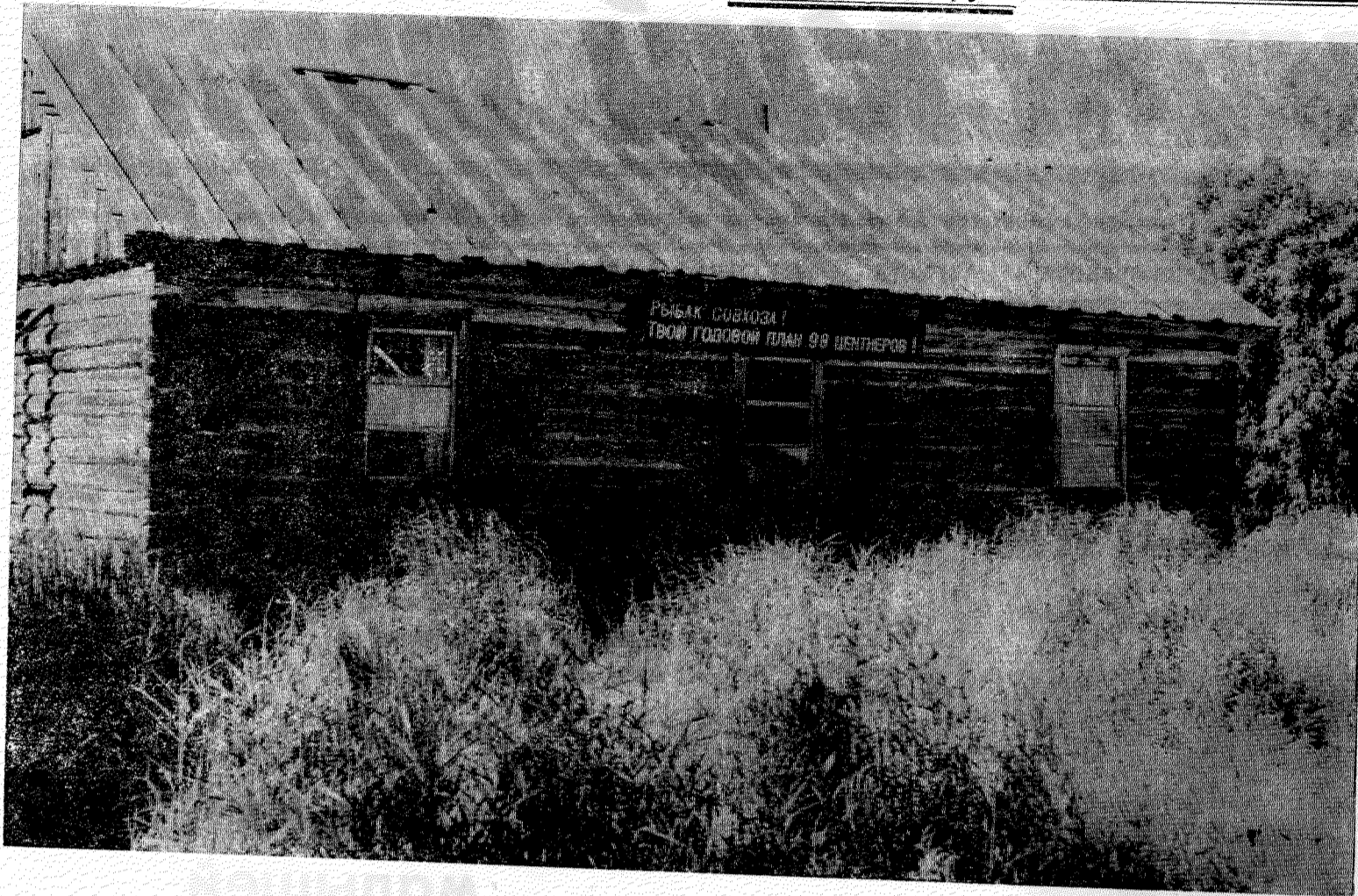
Надпись на плакате: «Рыбак совхоза! Твой годовой план 98 центнеров!»