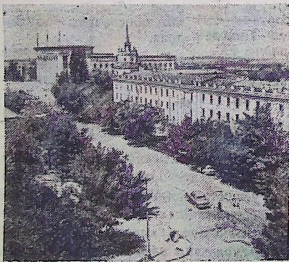
Комсомольская улица в столице республики—Алма-Ате.