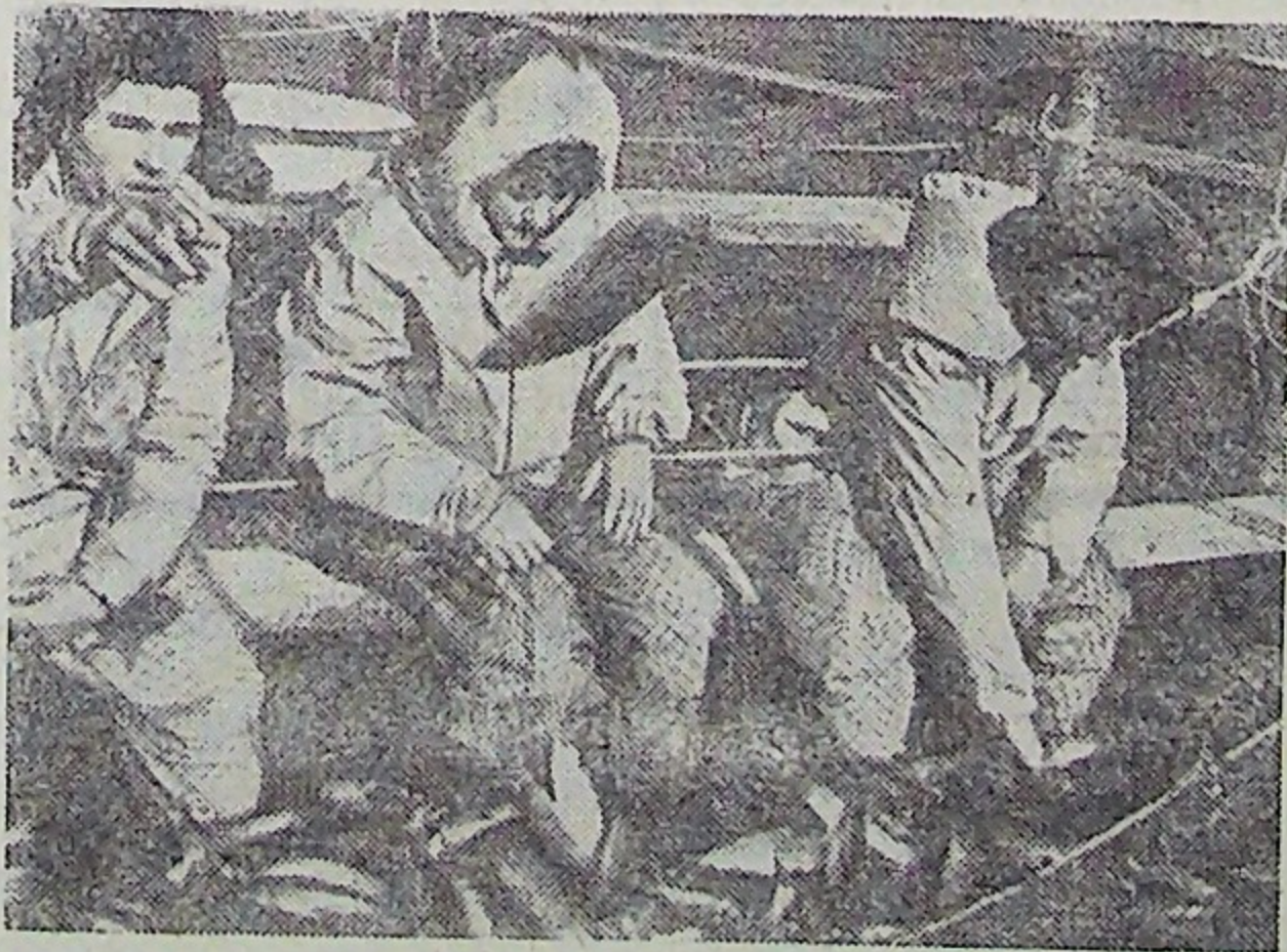
БУРЯТСКАЯ АССР. В этом году на рыболовных заводах Бурятии намечено заложить на инкубацию миллиард 750 миллионов икринок рыбы. Возводятся два новых предприятия — Баргузинский и Селенгинский заводы. С их вводом планируется инкубация до четырех миллиардов осетрово-омулевых икринок в год. На снимке: хозяева временных садков Селенгинского рыболовного завода.