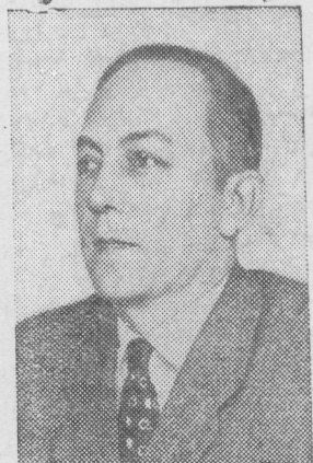
Леон Кручковский — писатель (Польша).