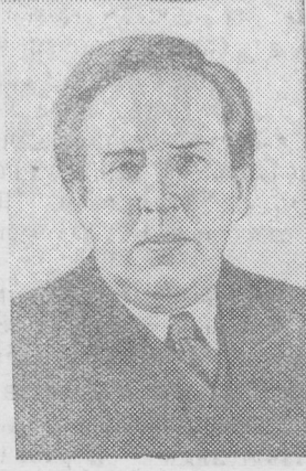
Джон Бернал — профессор Лондонского университета (Англия)