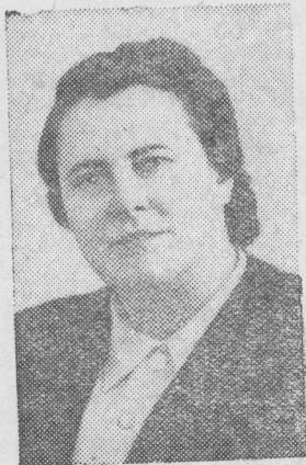
Попова Н. В. — секретарь Всесоюзного Центрального Совета профсоюзов (СССР).