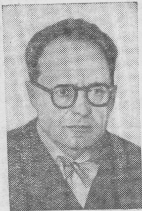
Пьер Кот — депутат национального собрания (Франция).