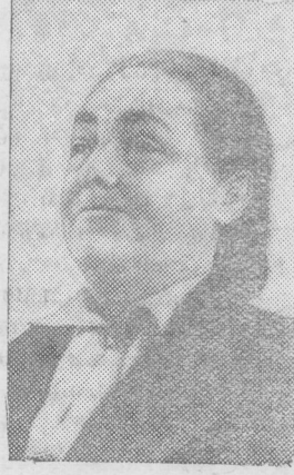
Изабелла Блум — депутат парламента (Бельгия).