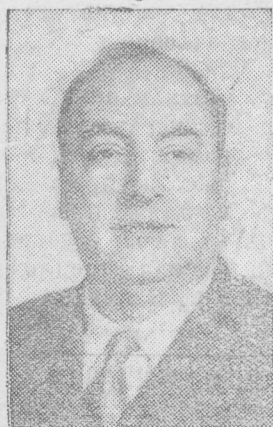
Пабло Неруда — писатель (Чили).