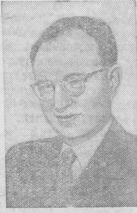
Говард Фаст — писатель (США).