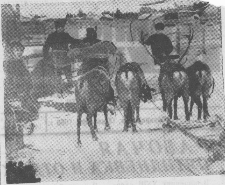
«Амфибия» — хорошо, но олени лучше.