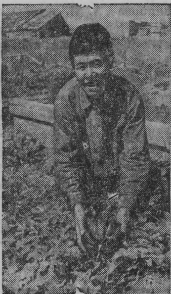
В парниках Александровского молочно-овощного совхоза на Сахалине выращивают арбузы.

Сельхозартели „Красное Кузнецово“, Калининского района, „Пролетарий“, Октябрьского района, первыми выполнили обязательства по сдаче льнопродукта государству. ТАСС.